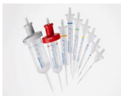
Combitips advanced 分液管

*买任意两盒 10ml 及以下规格的分液管, 送一个 eppendorf 原装分液管盒